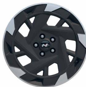
19" kola z lehké slitiny N Line