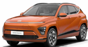
Jupiter Orange Metalická Kombinace s černým lakováním střechy Cena: 17 900 Kč