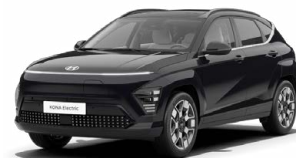
Abbyss Black Pearl Perleťová Cena: 17 900 Kč