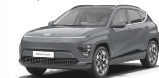
Ecotronic Gray Perleťová Kombinace s černým lakováním střechy Cena: 17 900 Kč