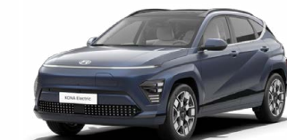
Sailing Blue Perleťová Kombinace s černým lakováním střechy Cena: 17 900 Kč