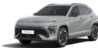
Shadow Grey Speciální pastelová Kombinace s černým lakováním střechy Cena: 17 900 Kč Pouze pro N Line