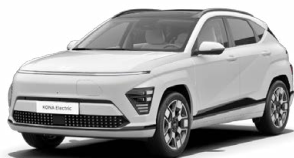
Atlas White Speciální pastelová Kombinace s černým lakováním střechy Cena: 10 000 Kč