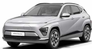
Shimmering Silver Metalická Kombinace s černým lakováním střechy Cena: 17 900 Kč