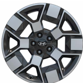
19" kola z lehké slitiny