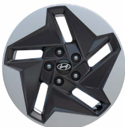
17" kola z lehké slitiny