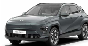
Cypress Green Perleťová Kombinace s černým lakováním střechy Cena: 17 900 Kč