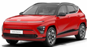
Engine Red Pastelová Kombinace s černým lakováním střechy Cena: 0 Kč