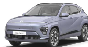
Meta Blue Pearl Metalická Kombinace s černým lakováním střechy Cena: 17 900 Kč