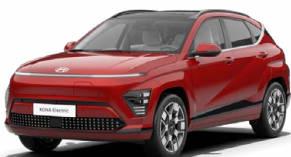
Ultimate Red Metalická Kombinace s černým lakováním střechy Cena: 17 900 Kč